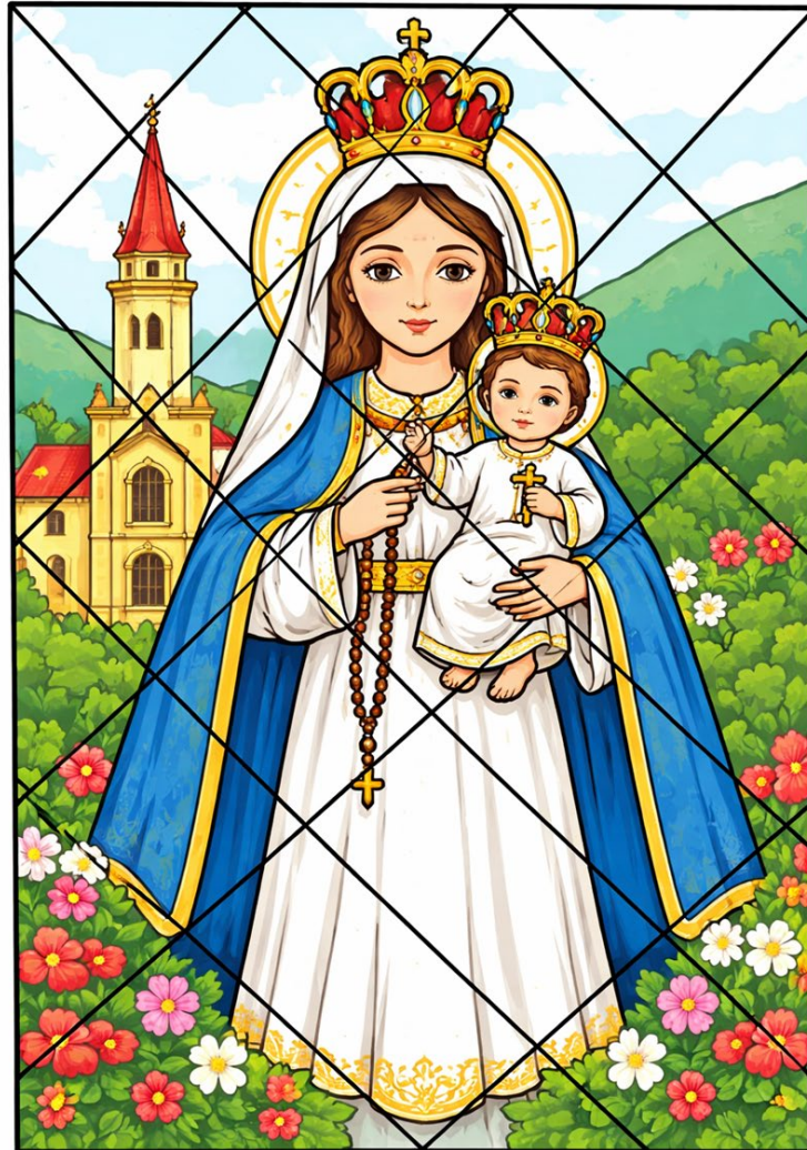
Majka Božja Bistrička

Rad u paru. Učenici će slagati izrezane dijelove slike "Majke Božje Bistričke" i pokušati uočiti detalje (krunu, Isusa u naručju).